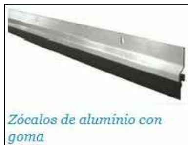
Zócalos de aluminio con goma