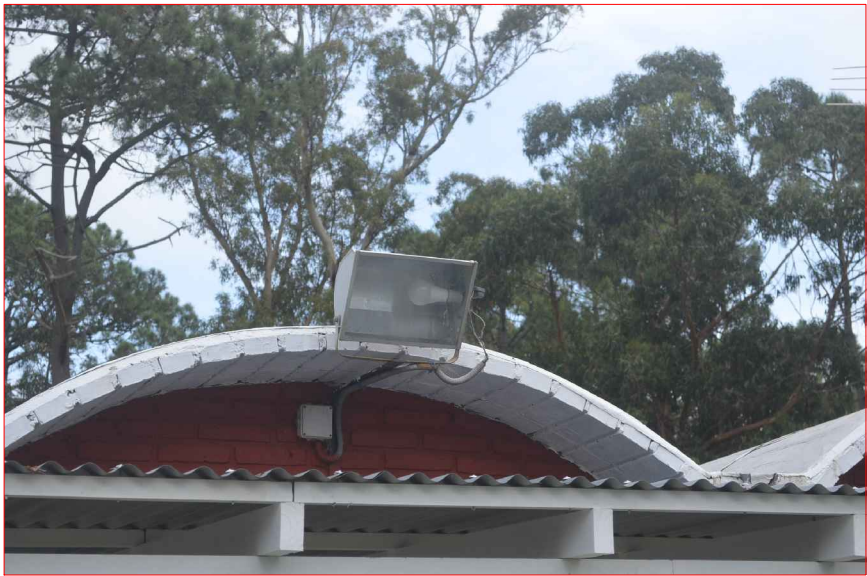
5 ARTEFACTOS A SUSTITUIR