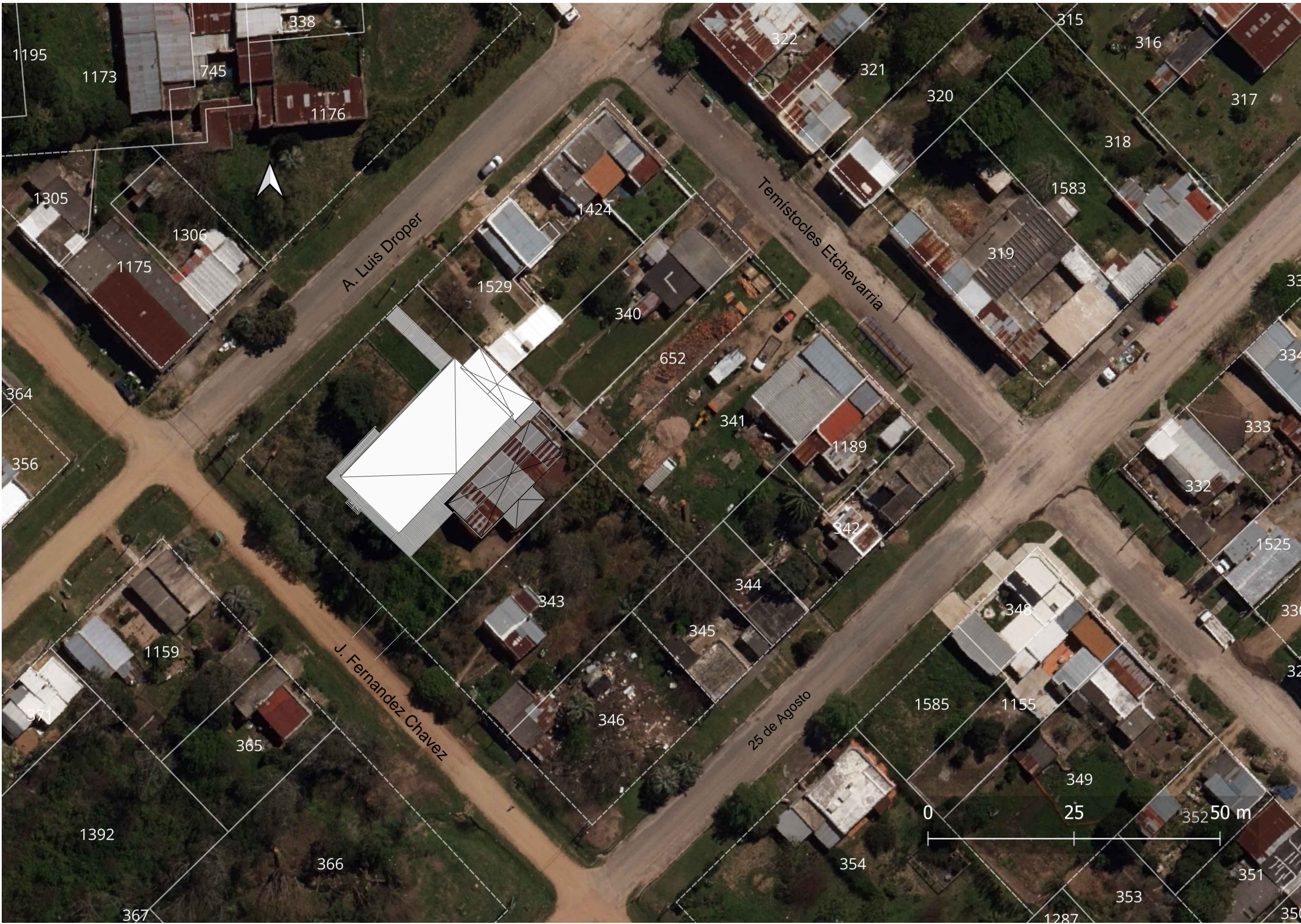
FOTO ÁEREA ESC 1_750