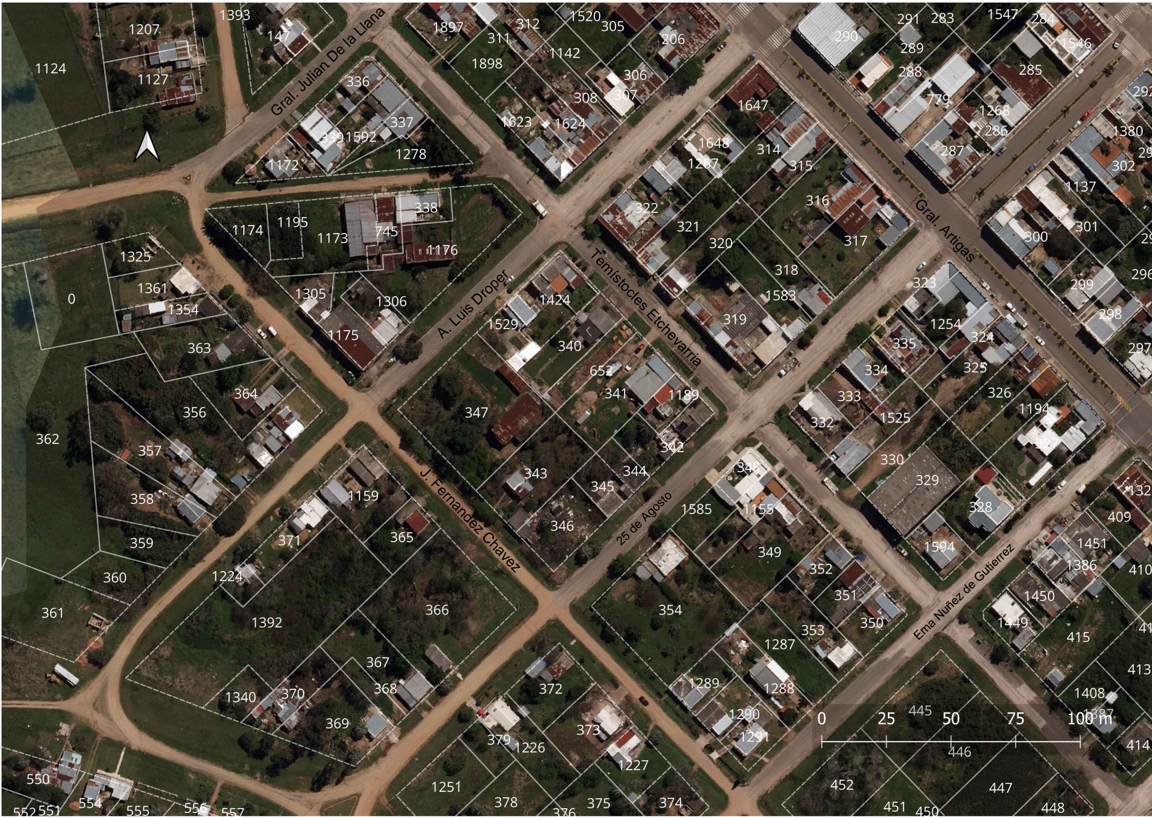
FOTO ÁEREA ESC 1_1500