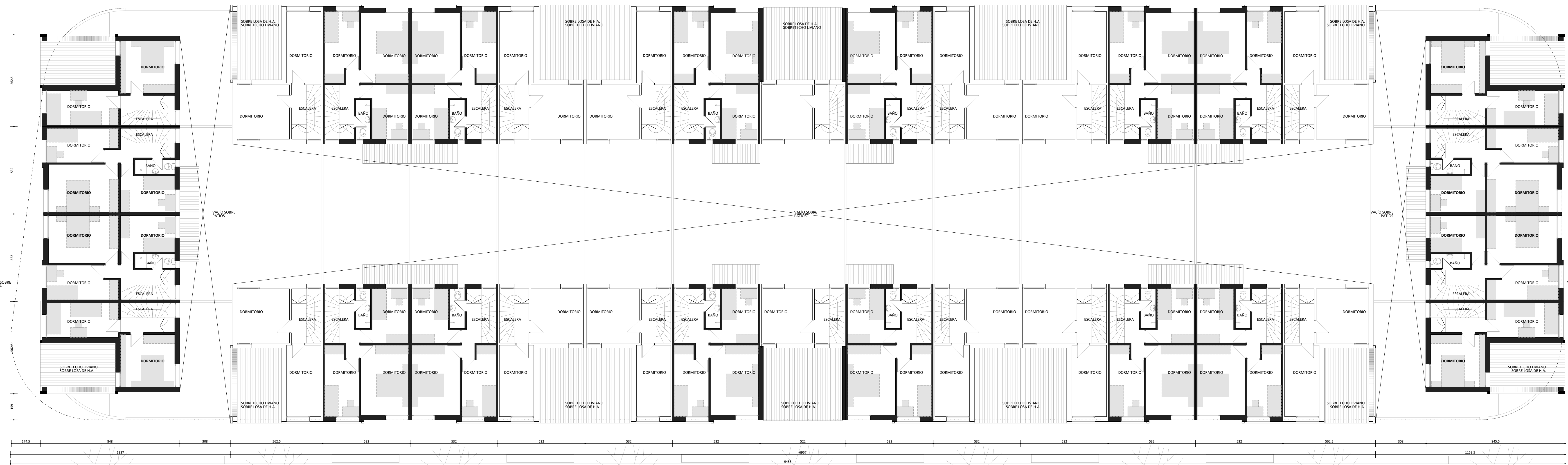
planta ALTA Esc: 1/100